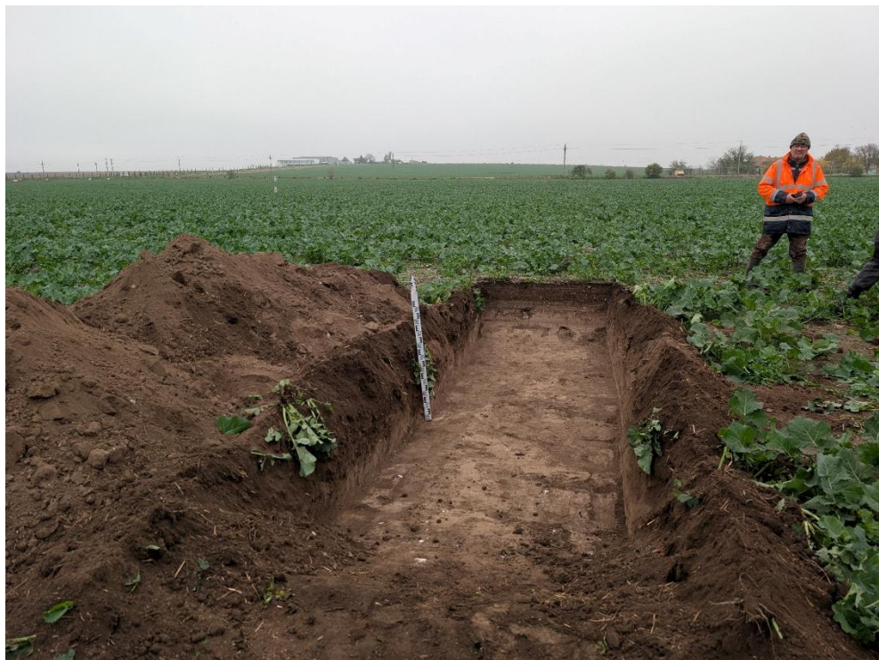
16. Secțiunea S12 – vedere către Nord