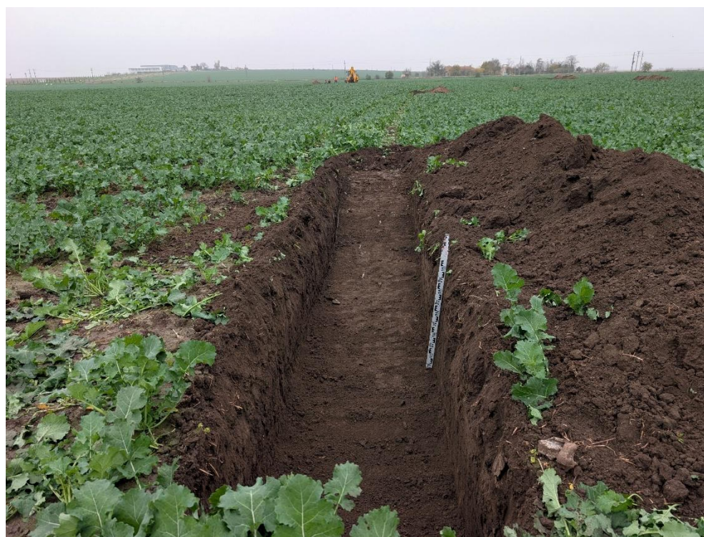
14. Secțiunea S10 – vedere către Nord