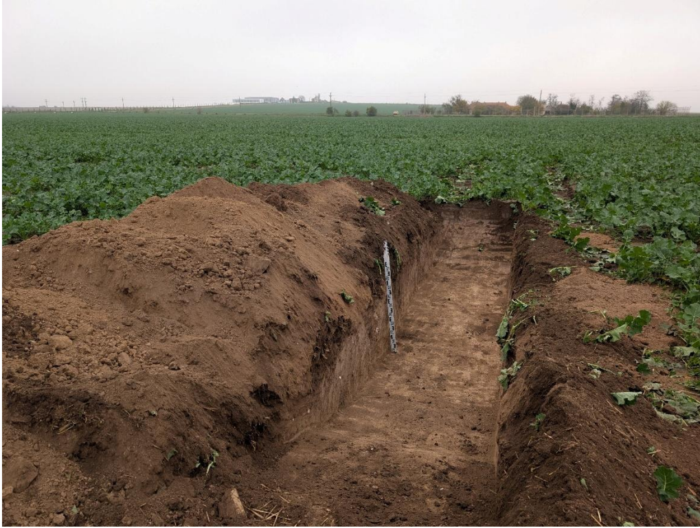
9. Secțiunea S5 – vedere către Nord