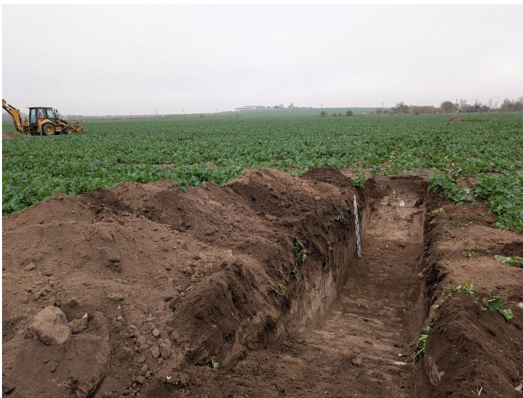
8. Secțiunea S4 – vedere către Nord