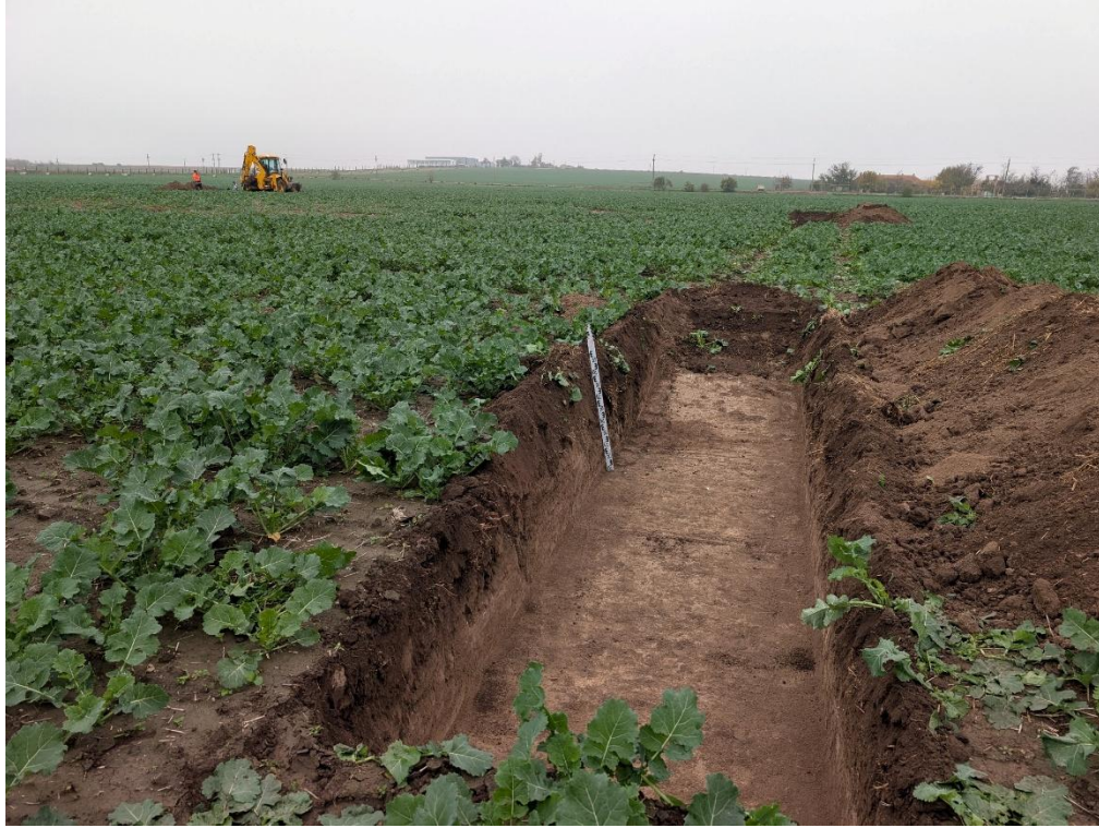
11. Secțiunea S7 – vedere către Nord