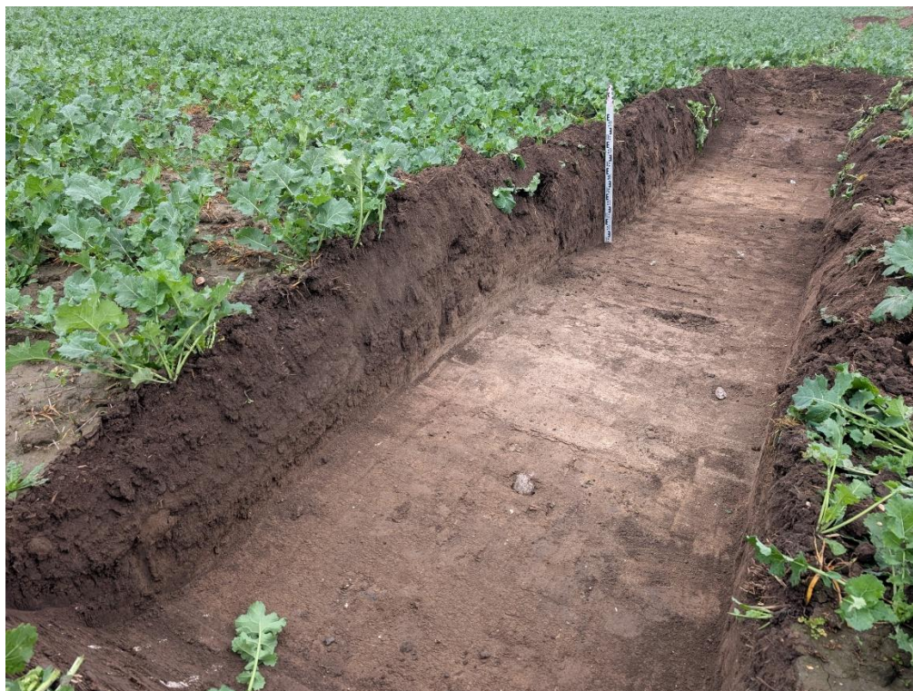
13. Secțiunea S9 – vedere către NV