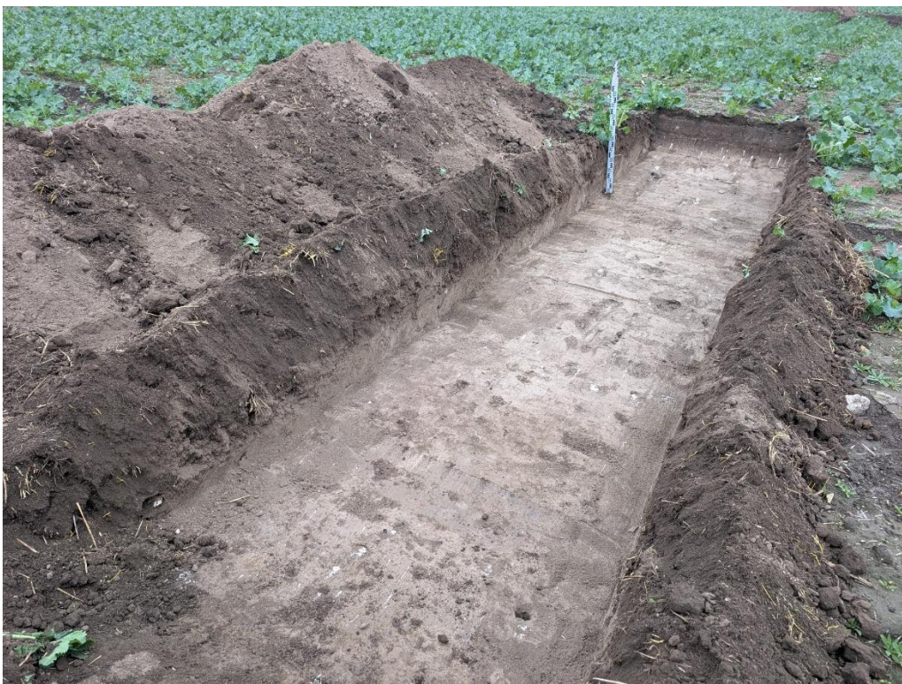
6. Secțiunea S2 – vedere către NV