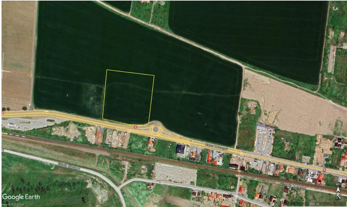
1. Localizarea amplasamentului studiat (fundal Google Earth 2024)