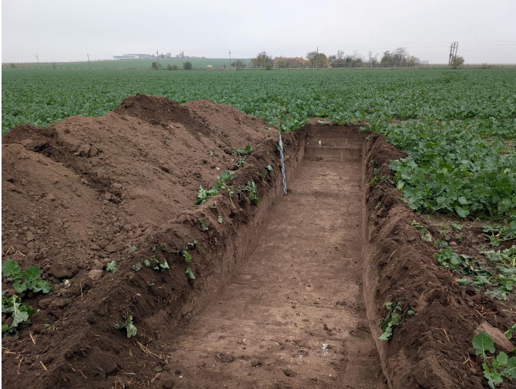
5. Secțiunea S1 – vedere către Nord