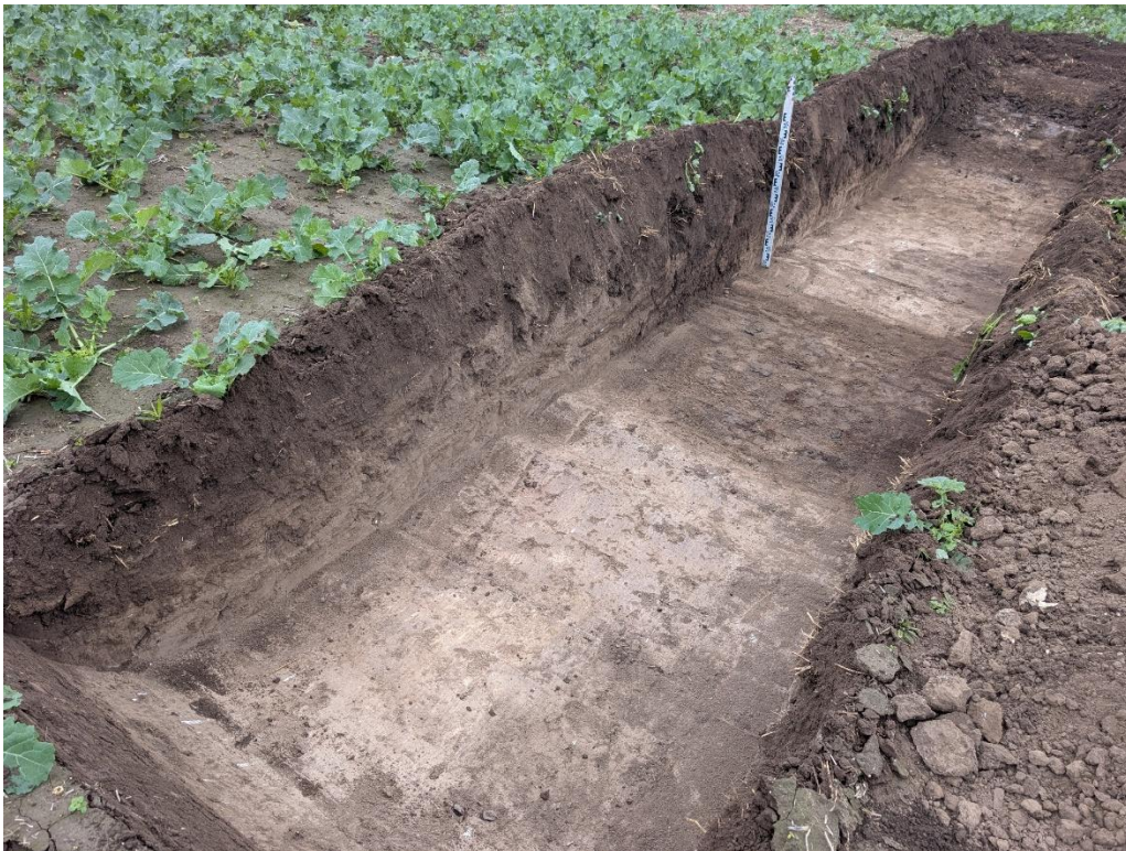
10. Secțiunea S6 – vedere către NV