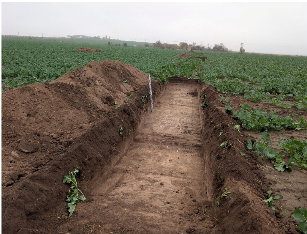
7. Secțiunea S3 – vedere către Nord