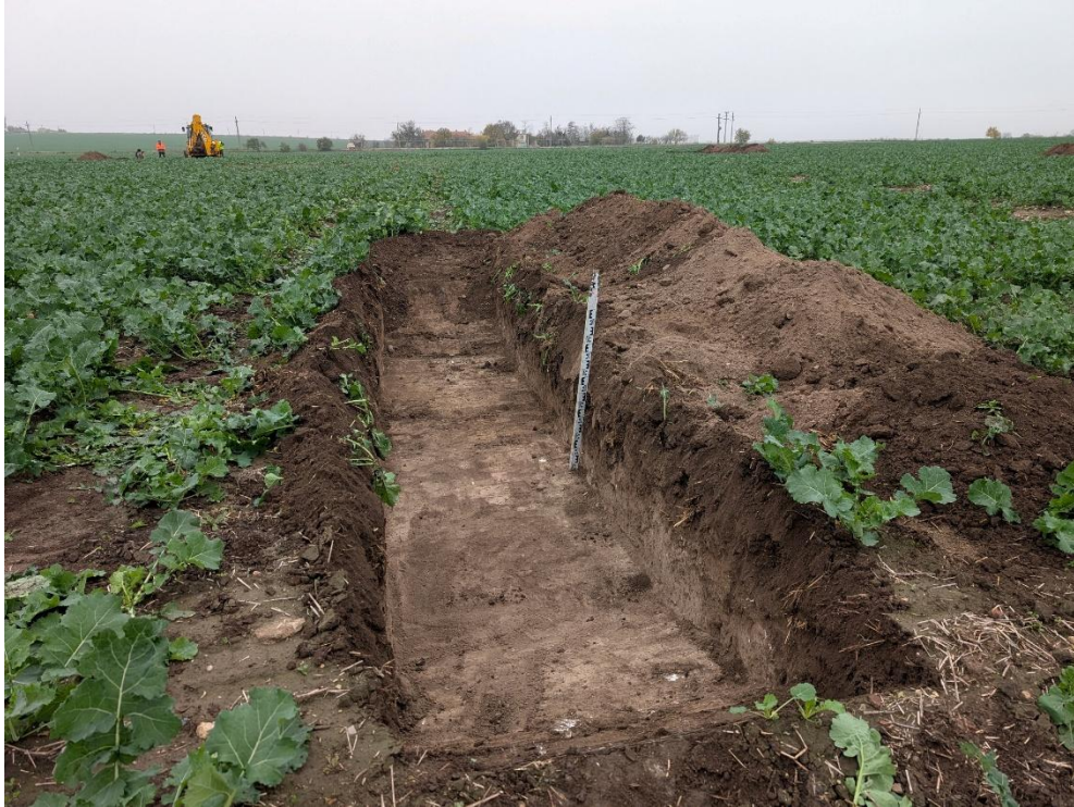
15. Secțiunea S11 – vedere către Nord