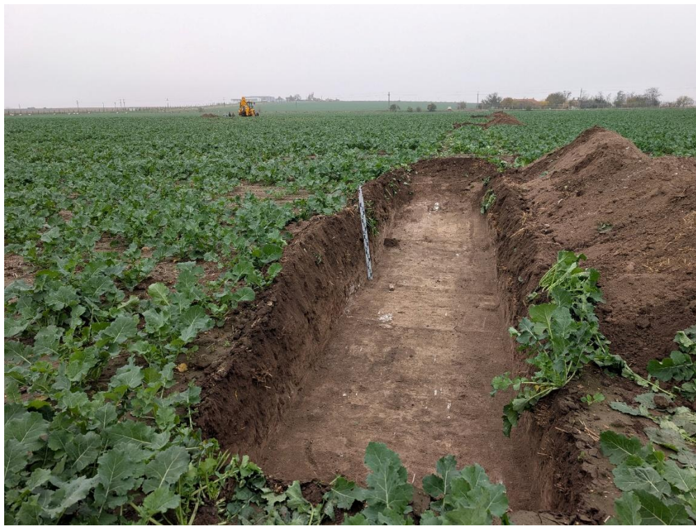
12. Secțiunea S8 – vedere către Nord