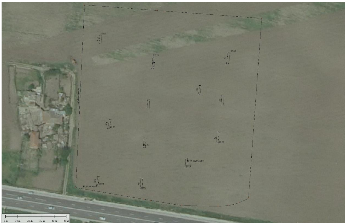
3. Planul secțiunilor de diagnostic (fundal ortofotoplan 2008)