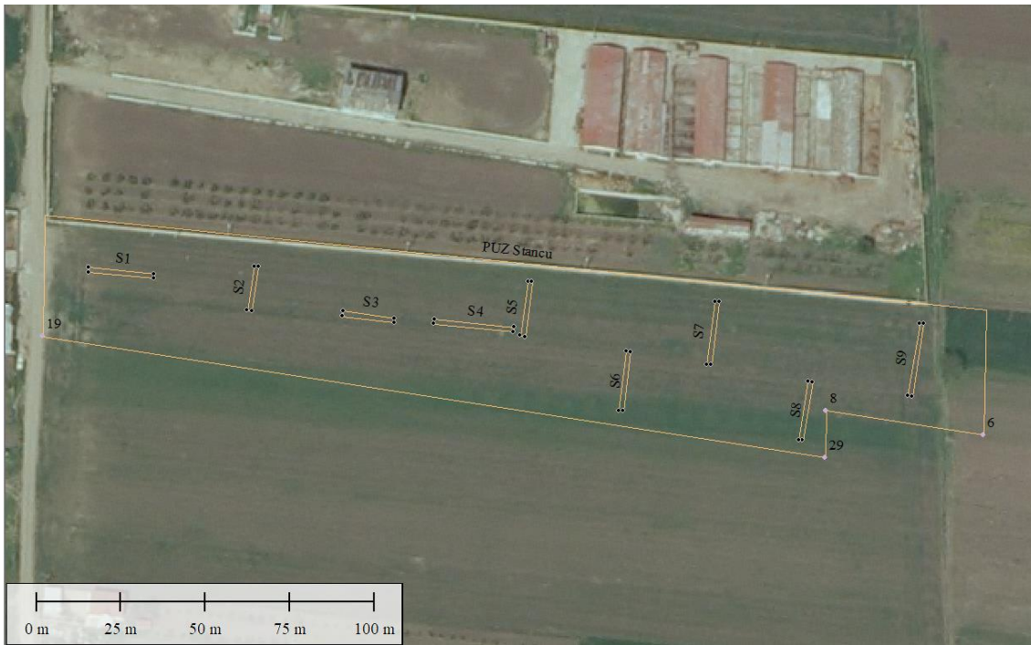
Plan general cu dispunerea secțiunilor de diagnostic pe amplasamentului studiat (ortofoto 2008)